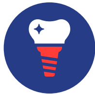
IMPIANTI Non rimborsati!