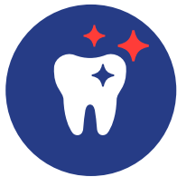
ESTETICA Non rimborsata!