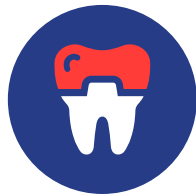
CORONE Non rimborsate!