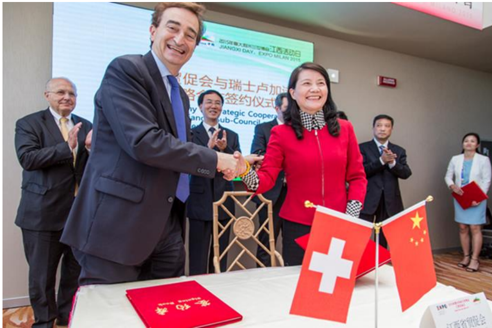
Firma di un MoU con Jiangxi CCPIT* Sub council all'EXPO 2015 Milano 与江西省贸促会CCPIT于米兰世博会签署备忘录