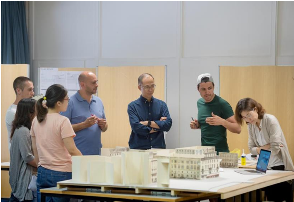
Workshop Sino-Swiss tra SUPSI e ZJU sull'architettura sostenibile e le energie rinnovabili 瑞士南方科技应用大学与浙江大学 绿色建筑材料应用研讨会