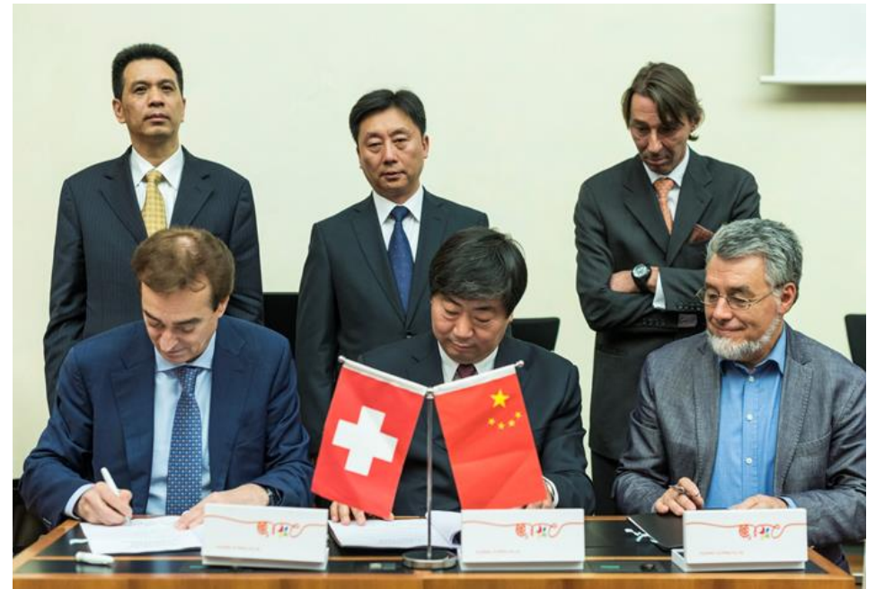
Firma dell'accordo multi-settoriale tra la Città di Lugano, ERSL e la Provincia di Jiangxi 与江西省南昌高新区合作协议签署