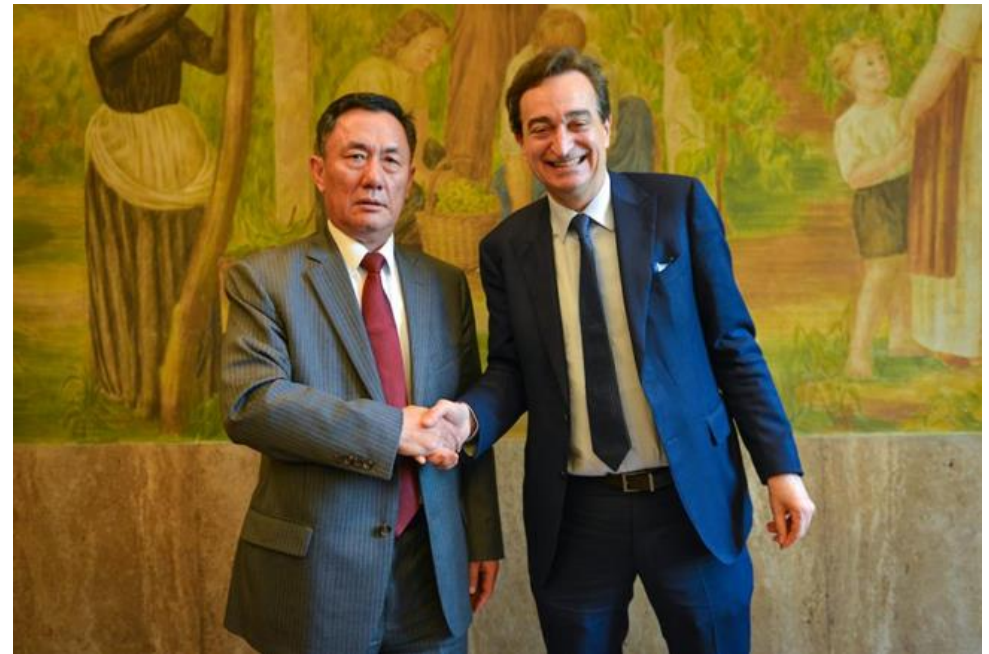
Visita dell'ambasciatore cinese a Berna, S.E Geng Wenbing a Lugano 2017年4月耿文兵大使到访卢加诺