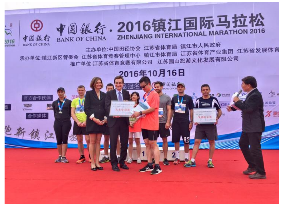
«Lugano Award» Zhenjiang International Marathon 镇江国际马拉松 «卢加诺奖»