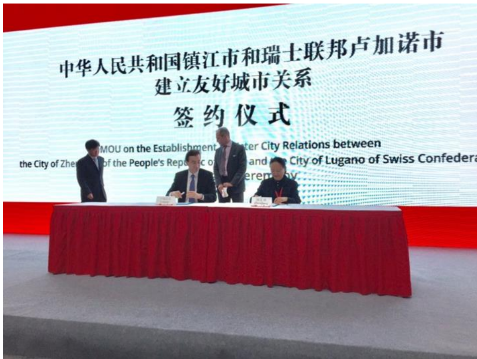
Missione in Cina «Lugano Day 2016» alla Città di Zhenjiang 中瑞生态产业园 «2016卢加诺日» 友城关系签署